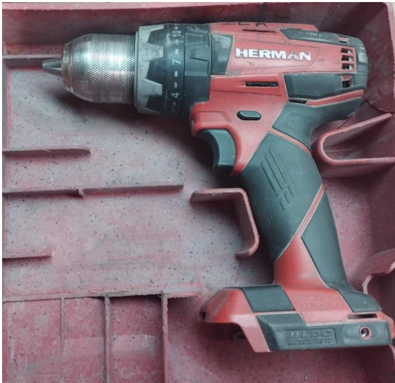
Obr.1 Stav náradia pri prijme