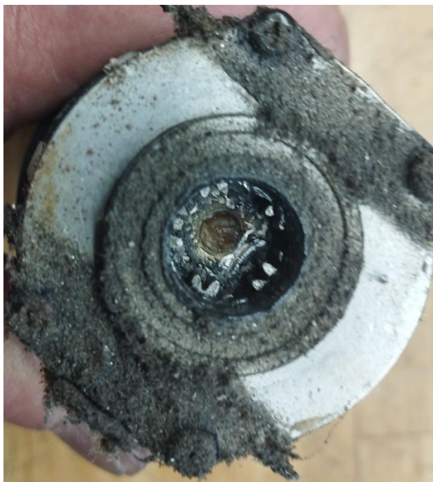
Obr.2 Znečistenie plášťa prevodovky